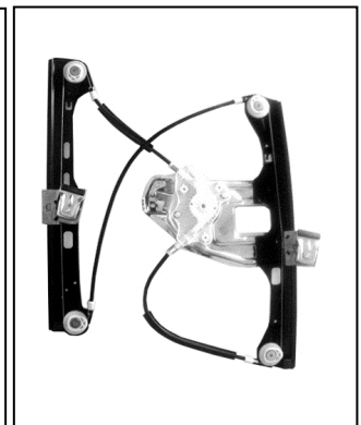
Nostro alzacristallo – our window regulator – notre lève-vitre – unser Fensterheber – nuestro elevalunas – nosso levantador de vidro – bizim cam acacagi – Γρύλος δικός μας